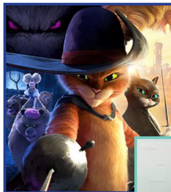
Le Chat Potté 2

VACANCES D'HIVER AU CINÉMA BONNE GARDE Cin & Théâtre pour petits et plus grands !